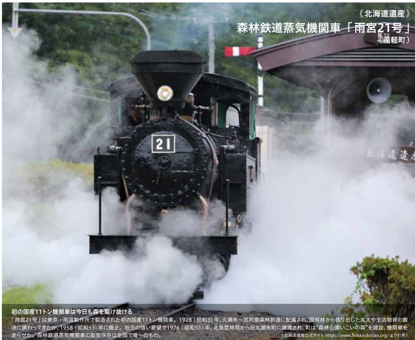
《北海道遺産》 森林鉄道蒸気機関車「雨宮21号」 (遠軽町)