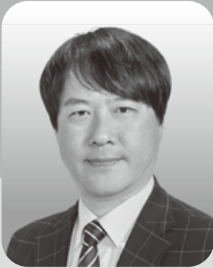
北海道印刷工業組合 理事長