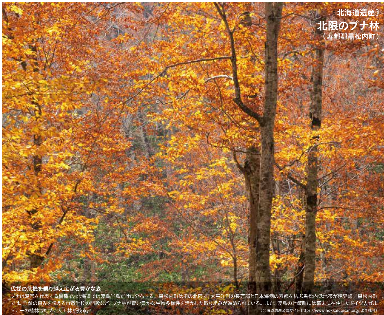
《北海道遺産》 北限のブナ林 (寿都郡黒松内町)