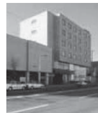
網走セントラルホテル