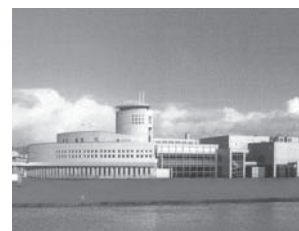
オホーツク・文化交流センター

8月5日(金)～7日(日) 併催行事 オホーツク・文化交流センター 網走市北2条西3丁目 TEL 0152-43-3704