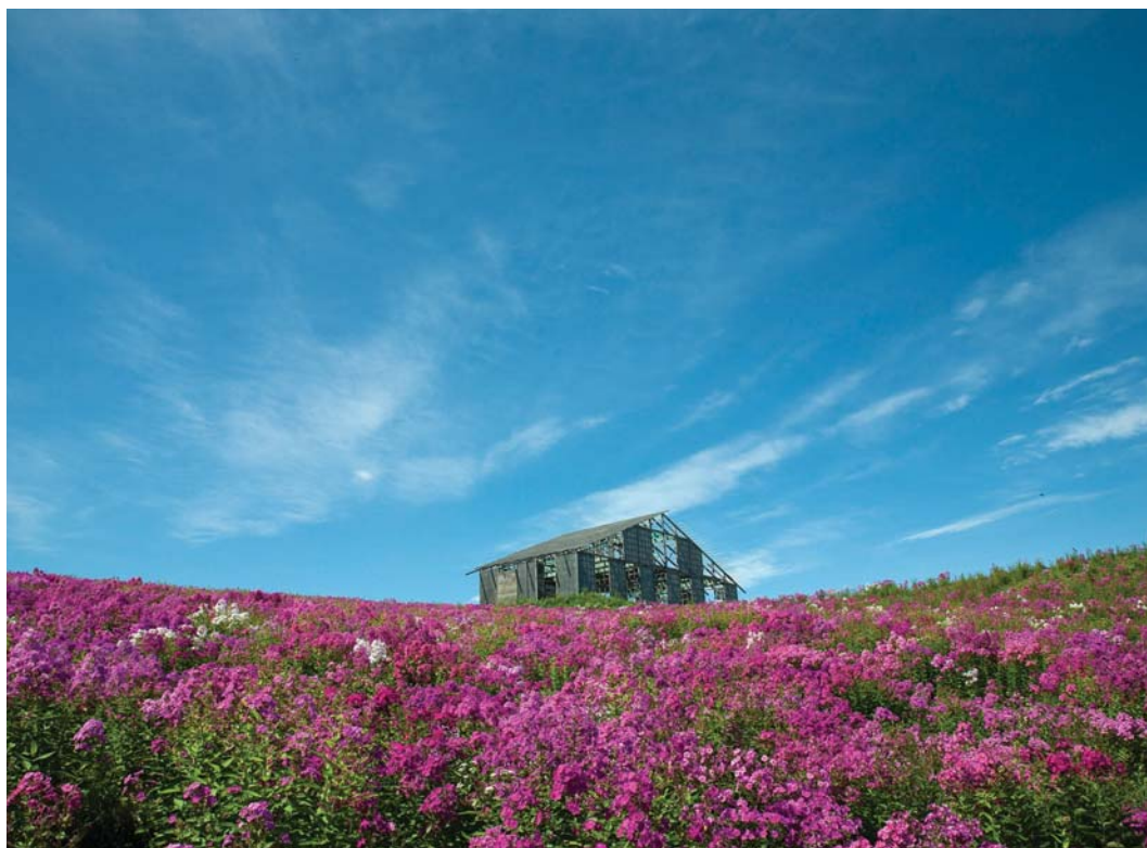
花の新名所「あばしりフロックス公園」