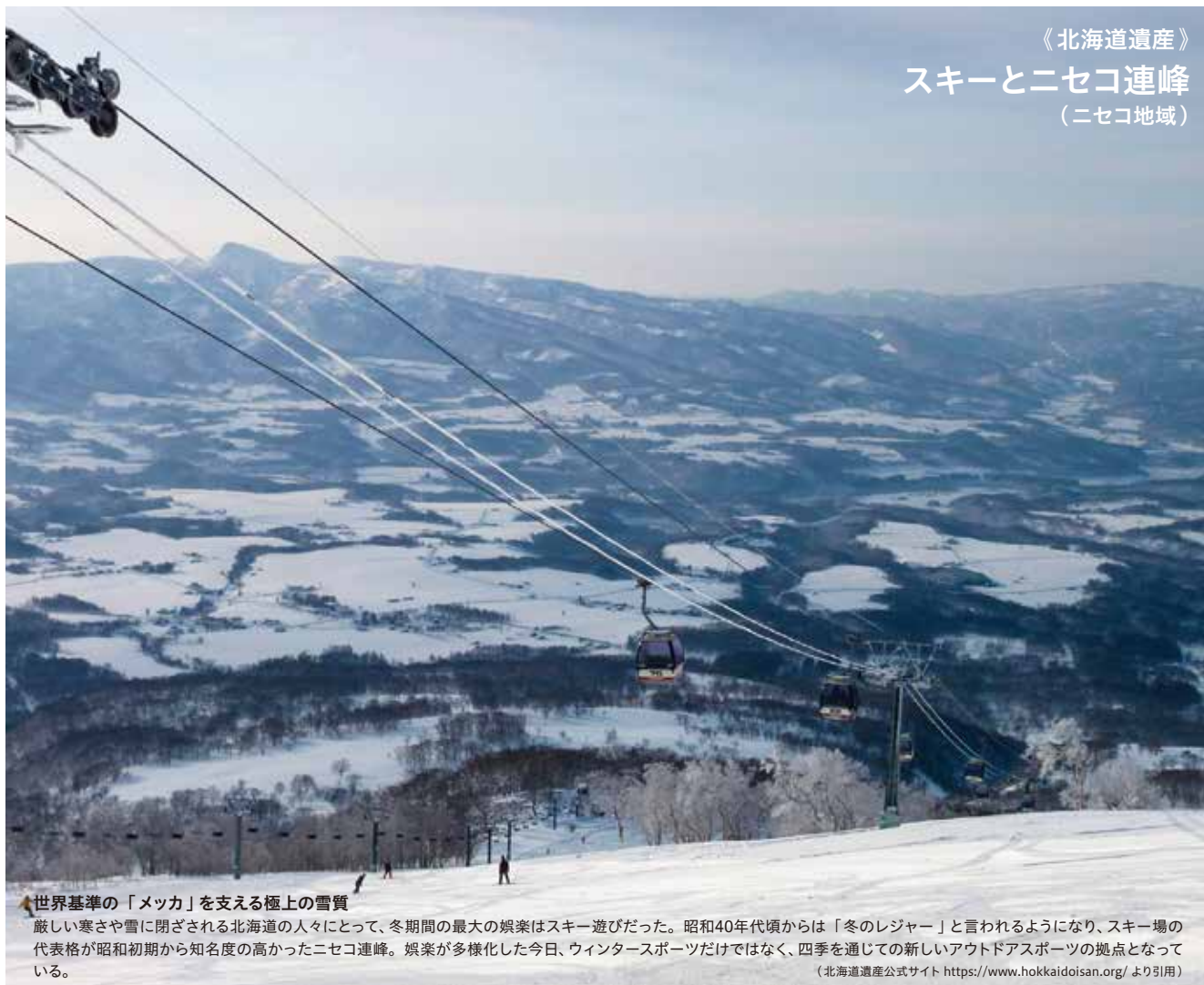
《北海道遺産》 スキーとニセコ連峰 (ニセコ地域)