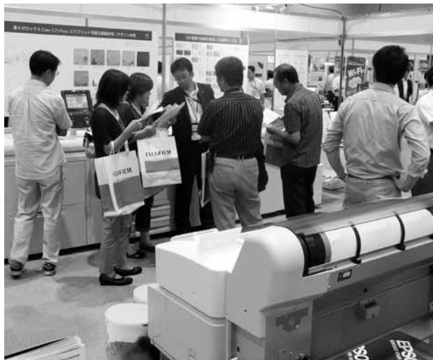
昨年の2014北海道情報・印刷産業展